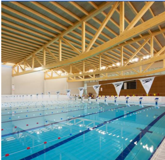
Red het zwemmen