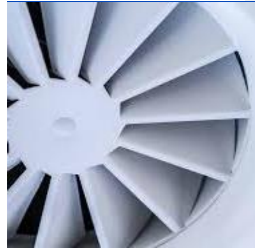
Luchtkwaliteit en ventilatie